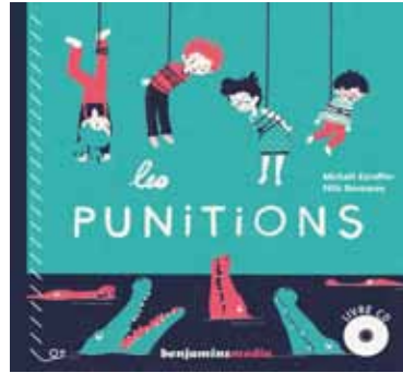
première de couverture